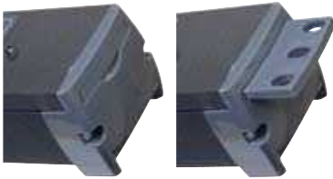
Befestigung an der Seite